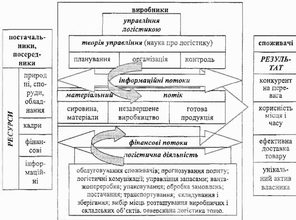
Рис. 2. Основні елементи логістики (розроблено автором на основі [10, с. 3])

Отже, відповідно до протилежного, маємо право стверджувати, що «логістика» як загальне поняття є ширшим, ніж «управління логістикою», і має використовуватися для позначення сфери господарської діяльності, пов'язаної з просуванням матеріальних потоків у системах постачання сировини та готової продукції. Відповідно, складовими частинами цієї сфери є: 1) матеріальні ресурси, які необхідні для виготовлення продукції, що піддається використанню для задоволення потреб споживачів; 2) безпосередньо логістична діяльність, яка забезпечує існування матеріального потоку; 3) комплекс виробничих, транспортних, складських потужностей разом з відповідними технічними засобами, обладнанням і облаштуваннями, які використовуються для виконання комплексу операцій логістичної діяльності (інфраструктура логістичної діяльності); 4) управління логістикою — як сукупність процесів планування, організації, обліку, контролю, регулювання разом з комплексом засобів збирання, зберігання, опрацювання і передачі інформації; 5) теорія логістики — як методологія логістичної діяльності та управління нею у поєднанні з використовуваним для цього науково-методичним, нормативно-правовим, організаційним та іншим забезпеченням (рис. 2).