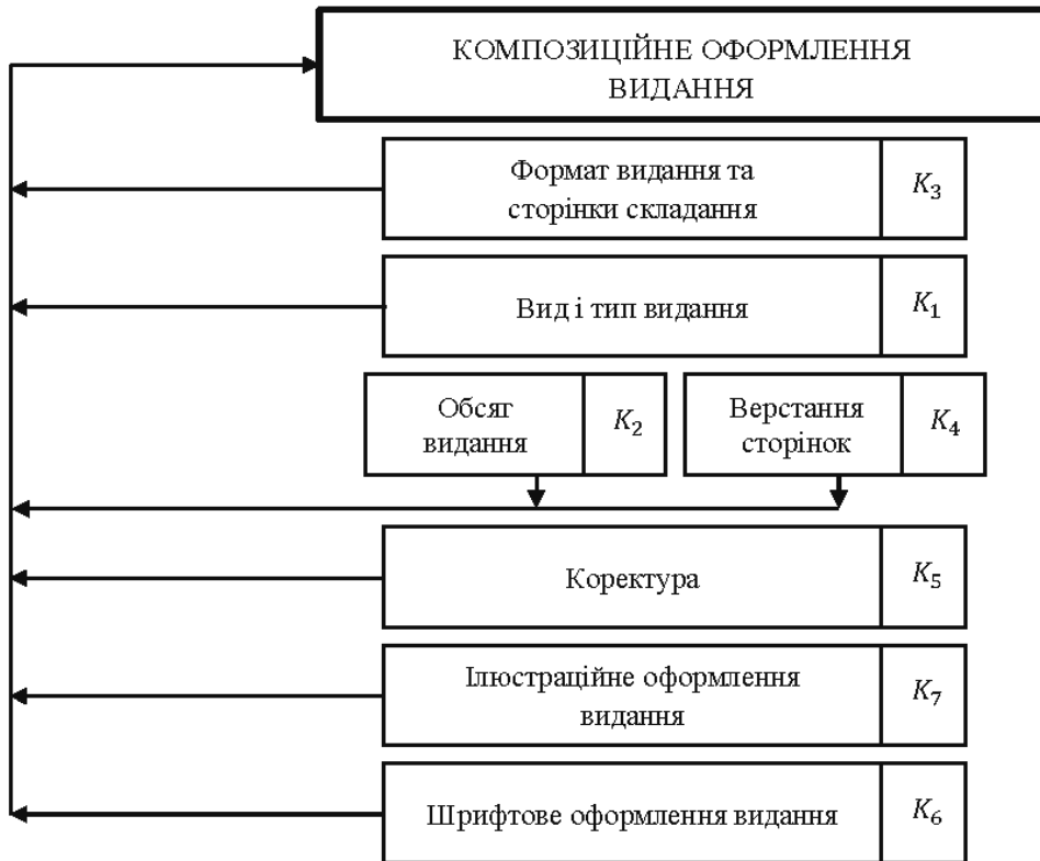
Рис. 1. Вхідна модель пріоритетного впливу факторів на процес композиційного оформлення видання

На рис. 1 зображено модель пріоритетного впливу факторів на процес композиційного оформлення видання, яка отримана за допомогою методу ранжування факторів [7] і потребує подальшої оптимізації.