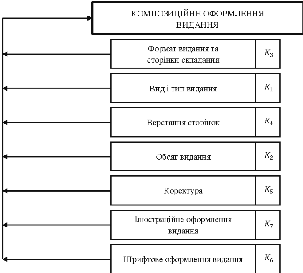
Рис. 4. Оптимізована модель пріоритетного впливу факторів на процес композиційного оформлення видання

Проаналізувавши рис. 2 і рис. 3, бачимо, що для синтезування оптимізованої моделі пріоритетного впливу факторів на процес композиційного оформлення видання необхідно використати компоненти нормалізованого вектора, оскільки в результаті нормалізації встановлено відмінні одне від одного вагові значення для факторів K_2 та K_4 . Таким чином, під час побудови оптимізованої моделі вдасться уникнути однакової пріоритетності факторів, яка може спостерігатися у моделі, отриманій шляхом ранжування факторів.