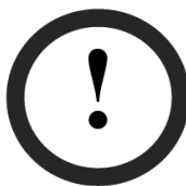
Рис. 2. Застережне маркування — книга, що містить дрібні елементи

Для книг, що містять інформацію негативного характеру а також нецензурну лексику запропоновано використовувати застережне маркування (рис. 3).