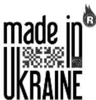
Рис. 4. Маркування на підтримку вітчизняного виробника

Таке явище надихає на те, щоб книги саме українських видавництв маркувалися знаком, що дасть можливість легко ідентифікувати продукцію українських видавництв (рис. 4.), а отже підтримати вітчизняного виробника.