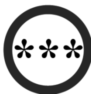
Рис. 3. Маркування, що містить нецензурну лексику або інформацію негативного змісту (вікове обмеження 18+)

Для книг, що містять інформацію негативного характеру а також нецензурну лексику запропоновано використовувати застережне маркування (рис. 3).