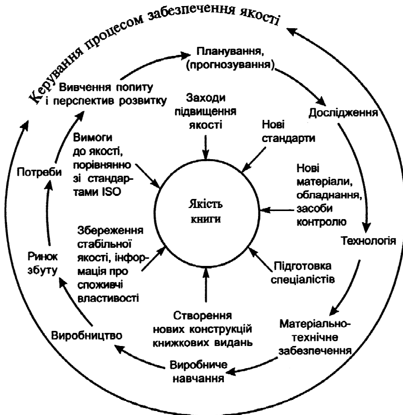
Рис. 1. Фактори впливу на якість книжкових видань

Разом з тим на передній план виходять властивості, які роблять книгу доброякісною, тобто зручною в користуванні. Серед них можна виділити такі, як надійність, кондиційність, релевантність, дизайн, соціально-ідеологічне значення [5 – 7]. Розглянемо зміст цих показників.