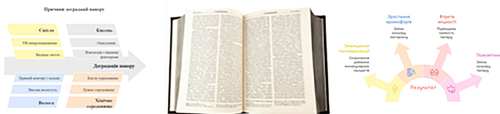
Рис.1. Вплив руйнівних чинників на папір

З хімічної точки зору деградація паперу є результатом комплексу реакцій, які ініціюються або каталізуються світлом, вологою, киснем, кислотними чи лужними середовищами. Ці процеси мають різні механізми, але зазвичай не протікають ізольовано - вони взаємодіють між собою, формуючи складну мережу взаємопов'язаних реакцій. Зниження якості та руйнування паперу обумовлюється комплексом хімічних процесів. До них належать кислотний гідроліз, лужна деградація та окислювальні реакції. Унаслідок цих процесів відбувається зменшення ступеня полімеризації целюлози, тобто скорочення довжини її молекулярних ланцюгів, а також зростає концентрація хромофорних груп, що відповідають за зміну кольору матеріалу (рис.1). На макроскопічному рівні це проявляється у втраті міцності, підвищеній ламкості паперу та його пожовтінні.